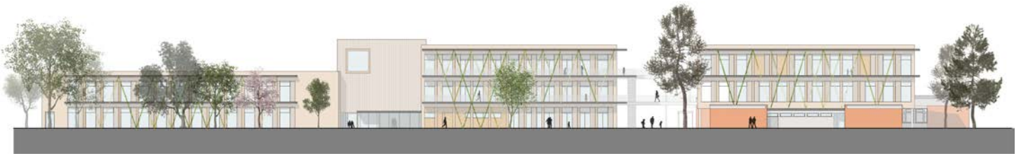
SÜDANSICHT - VARIANTE 1