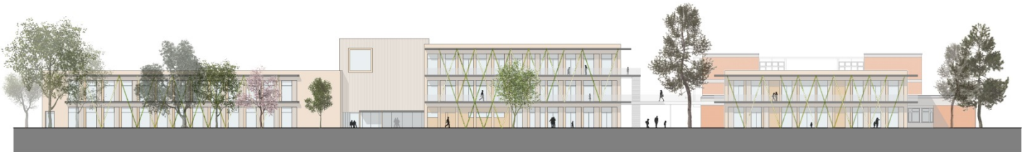
SÜDANSICHT - VARIANTE 2