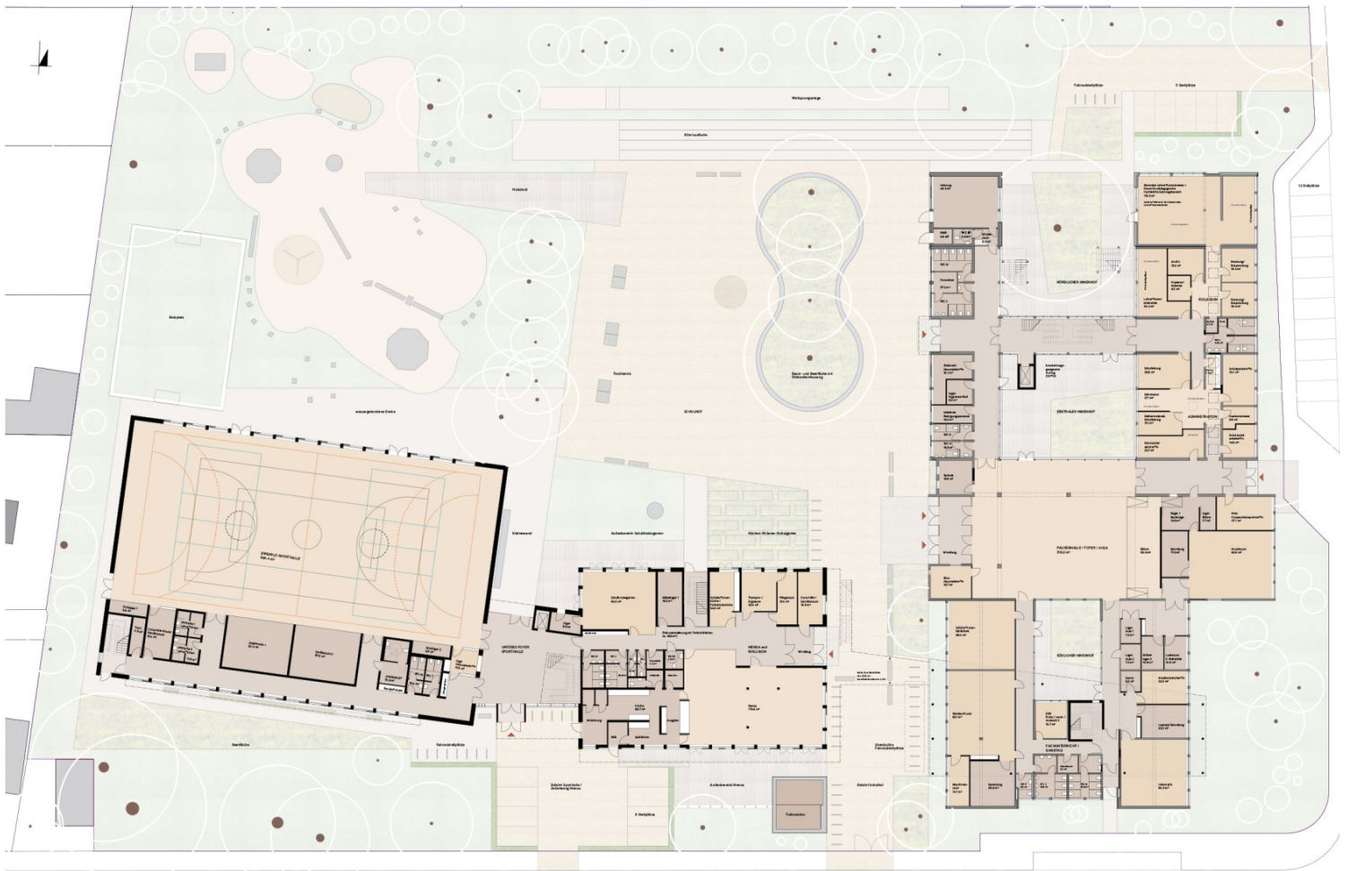
GRUNDRISS EG - VARIANTE 1